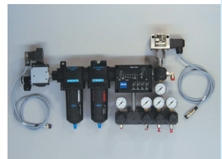
Überdimensionierte Filter und Bohrungen im Aluverteiler (Ausgleich-Druckschwankungen).