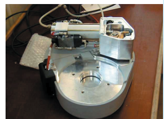
Der kompakte Drehantrieb ermöglicht Drehwinkel bis 53°.