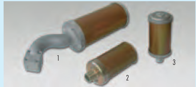
1 und 2 kundenspezifische Lösungen, 3 Hochdruckschalldämpfer Serie P